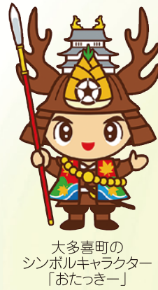
大多喜町のシンボルキャラクター「おたっきー」