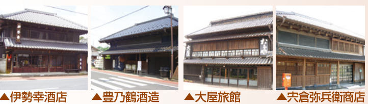
▲伊勢幸酒店 ▲豊乃鶴酒造 ▲大屋旅館 ▲穴倉弥兵衛商店

▲ 大多喜町役場中庁舎(日本庁舎) 昭和34年に建築された大多喜町役場旧庁舎は平成25年ユネスコアジア太平洋保全賞功績賞を受賞しました。