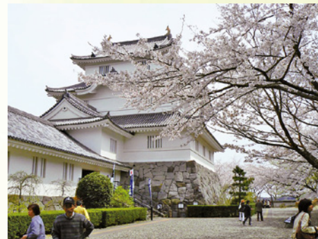
桜の見ごろ(3月下旬～4月上旬)