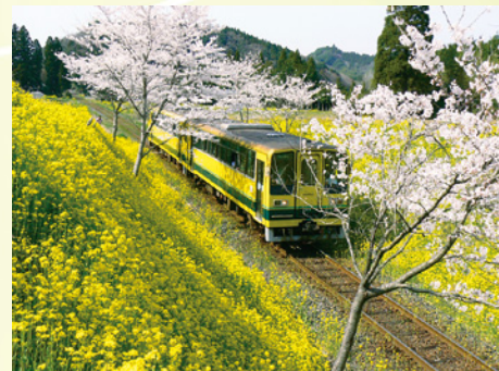
菜の花・桜の見ごろ(3月上旬～4月上旬)