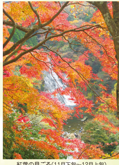
紅葉の見ごろ(11月下旬～12月上旬)