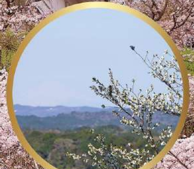
山なみを一望 大塚山展望公園