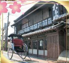
風情あふれる城下町通り