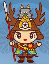
大多喜町シンボルキャラクター おたつきー