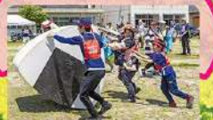
EAT&ART.TARO「おにぎりのための運動会」