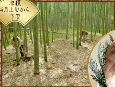
大多喜特産たけのこ